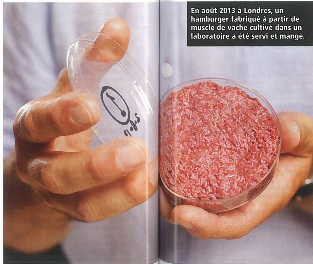
En août 2013 à Londres, un hamburger fabriqué à partir de muscle de vache cultivé dans un laboratoire a été servi et mangé.

Viande et sang de synthèse, à chaque fois ces inventions essaient de régler un problème courant. Dans le premier cas, la consommation en eau et en nourriture d'une vache destinée à l'abattoir, dans l'autre la pénurie de sang pour les transfusions. Fabriquer le